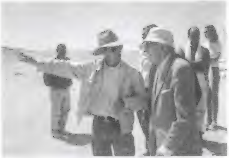
لوير ولابروس فى موقع هرم الملك بيبى عام ٢٠٠٠